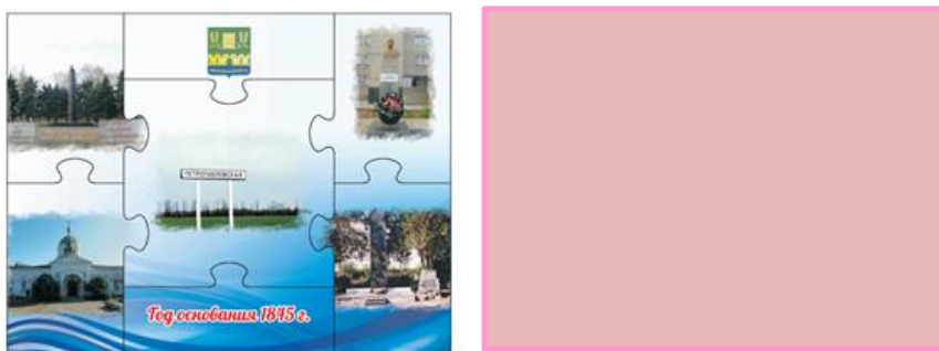
Рисунок 2. Карточка-блок для младших школьников.