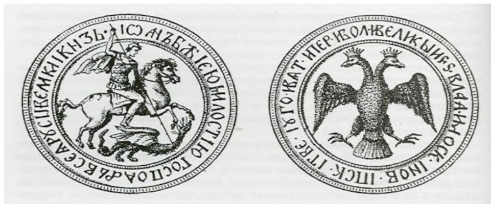
Печать Ивана III. 1497г.

Самое первое из сохранившихся достоверных свидетельств использования двуглавого орла в качестве символа Московского государства — великокняжеская печать Ивана III Васильевича, скрепившая жалованную грамоту 1497 года (на оборотной стороне этой печати изображён двуглавый орёл, увенчанный коронами).