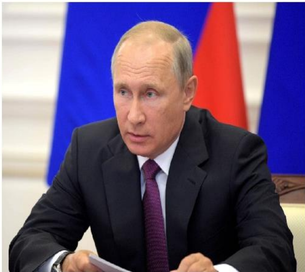
Владимир Владимирович Путин - ныне действующий Президент РФ