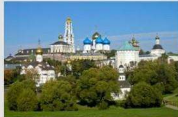
Архитектурный ансамбль Троице-Сергиевой лавры