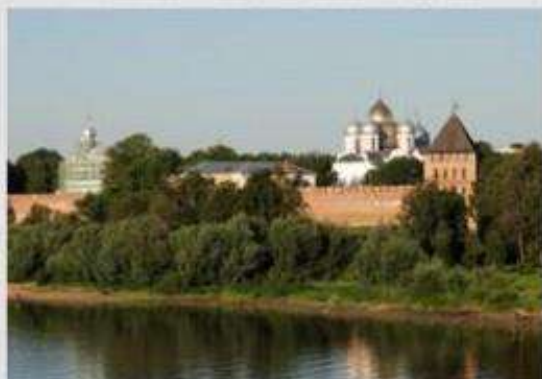
Исторические памятники Новгорода и окрестностей