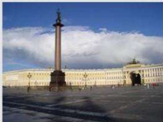
Исторический центр Санкт-Петербурга и связанные с ним комплексы памятников