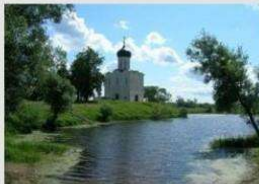
Белокаменные памятники Владимира и Суздаля