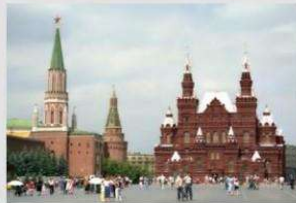
Московский Кремль и Красная площадь