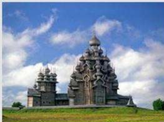
Архитектурный ансамбль Кижского погоста