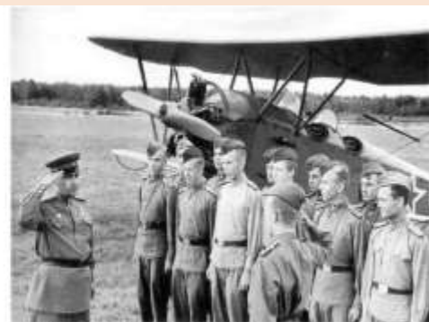
Алексей Маресьин в заводском училище, 1940 г.