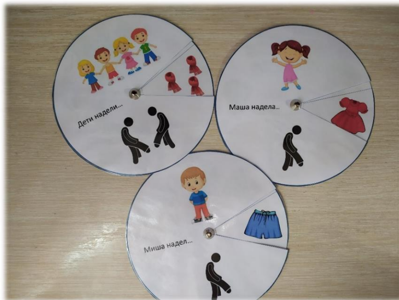
Схема описательного рассказа «Расскажи об одежде»

Ход игры: Ребенок вращает круги и составляет предложения (Маша надела платье и т.д.)