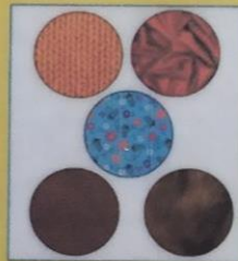
Из какого материала сделана?