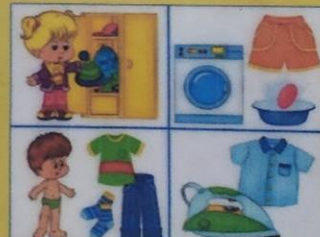
Действия с одеждой