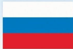
ГОСУДАРСТВЕННЫЙ ФЛАГ РОССИЙСКОЙ ФЕДЕРАЦИИ