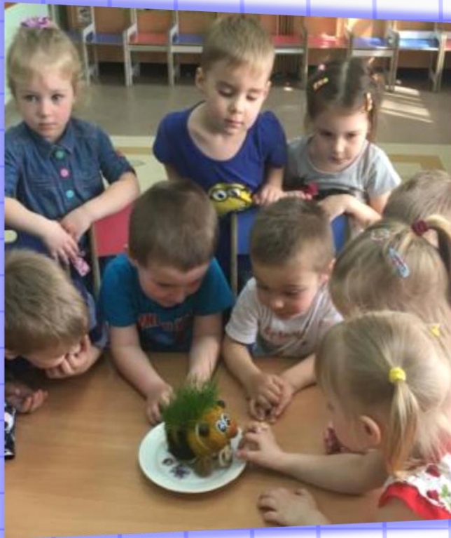
«Наш друг Травянчик»