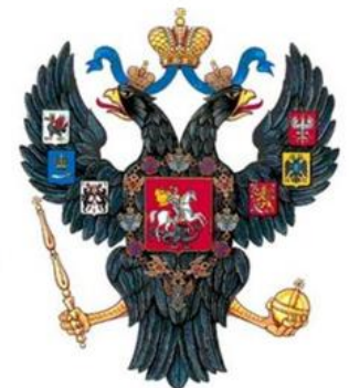
Различные изображения герба Российской империи