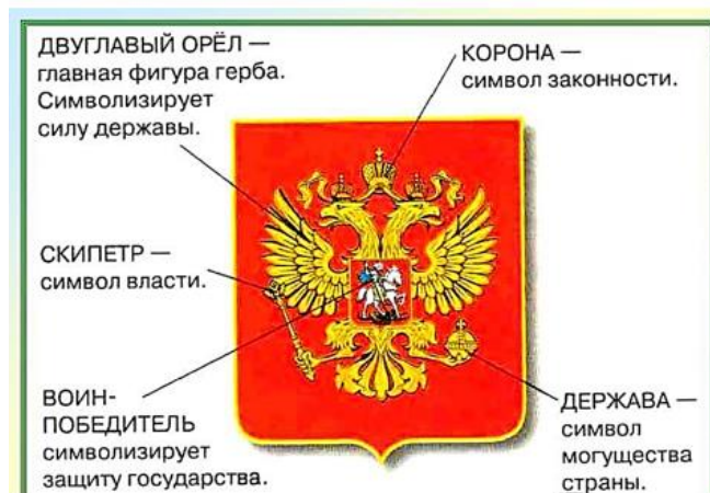
Рисунок современного герба выполнил художник Е.И. Ухналев. Современный Государственный герб Российской Федерации был принят в декабре 2000 года. Что же символизирует каждая составляющая часть Государственного герба Российской Федерации?

В законе "О Государственном гербе Российской Федерации" дано следующее его описание: "Государственный герб РФ представляет собой четырехугольный, с закругленными нижними углами, заостренный в оконечности красный геральдический щит с золотым двуглавым орлом, поднявшим вверх распущенные крылья. Орел увенчан двумя малыми коронами и над ними одной большой короной, соединенными лентой. В правой лапе орла – скипетр, в левой – держава. На груди орла в красном щите – серебряный всадник в синем плаще на серебряном коне, поражающий серебряным копьём черного, опрокинутого навзничь и попранного конем дракона".