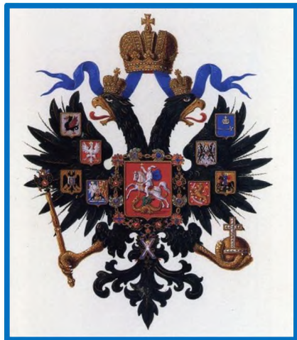
Герб Российской Империи 1857 года