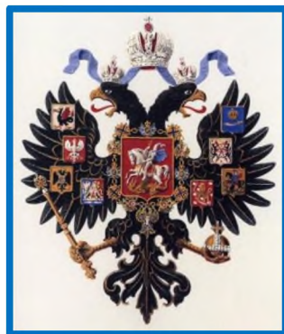
Герб Российской Империи 1882 года