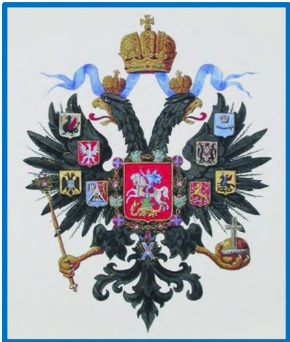
Герб Российской Империи 1856 года