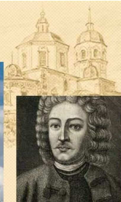
Проект архитектора Г. Матгарнови

Кабинет редкостей, в настоящее время — Музей антропологии и этнографии имени Петра Великого Российской академии наук, — первый музей России, учреждённый императором Петром I и находящийся в Питере, первое упоминание 1718 г.