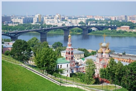
город Нижний Новгород