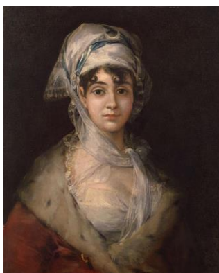
«Портрет актрисы» Ф.Гойя