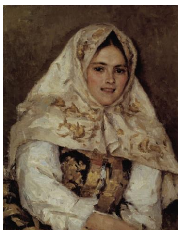
«Сибирская красавица» А.Суриков